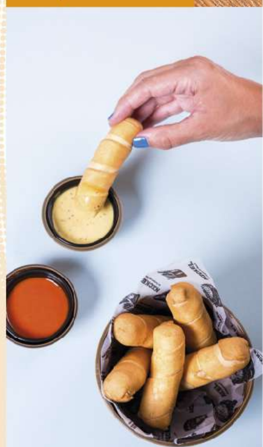
Tequeños de Queso.