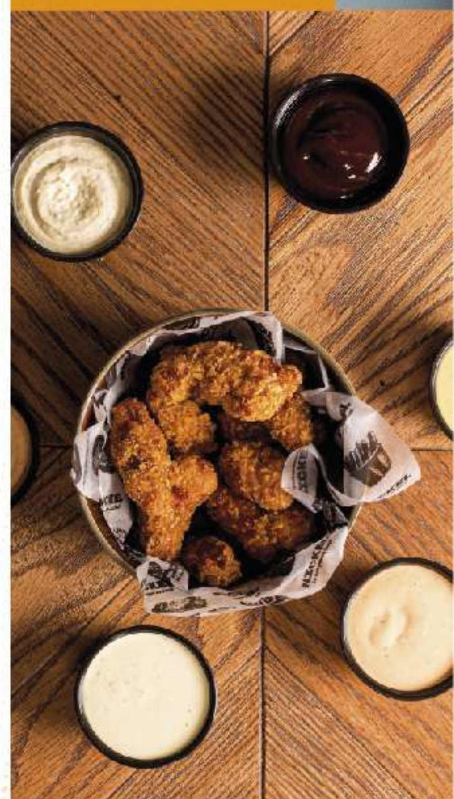
Crujientes de Pollo.